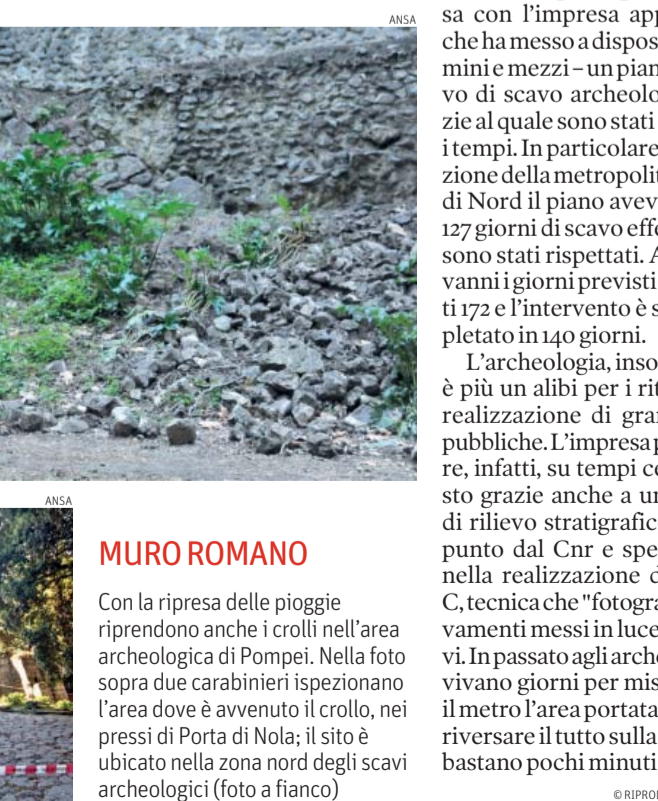
MURO ROMANO Con la ripresa delle piogge riprendono anche i crolli nell'area archeologica di Pompei. Nella foto sopra due carabinieri ispezionano l'area dove è avvenuto il crollo, nei pressi di Porta Nola; il sito è ubicato nella zona nord degli scavi archeologici (foto a fianco)

terventi sul sito campano e che rischia di rallentare ulteriormente il piano straordinario, il quale prevede anche un reclutamento ad hoc di personale tecnico, in deroga al blocco del turn over. A Pompei si aspettano, infatti, 12 archeologi, 7 architetti e alcuni amministrativi. Assunzioni previste dal decreto legge 34 di fine marzo scorso e la cui procedura è stata perfezionata dai Beni culturali con una norma (comma 92 dell'articolo 4) inserita nel disegno di legge di stabilità, ora all'esame del Senato. Quella disposizione è stata, però, dichiarata incompatibile con la struttura della manovra finanziaria e fatta confluire in un altro disegno di legge, che procederà al di fuori dei tempi contingenti della sessione di bilancio. Per un piano che naviga ancora nell'incertezza ce n'è, invece, un altro - sempre legato all'archeologia - arrivato in porto e i cui risultati verranno presenta-